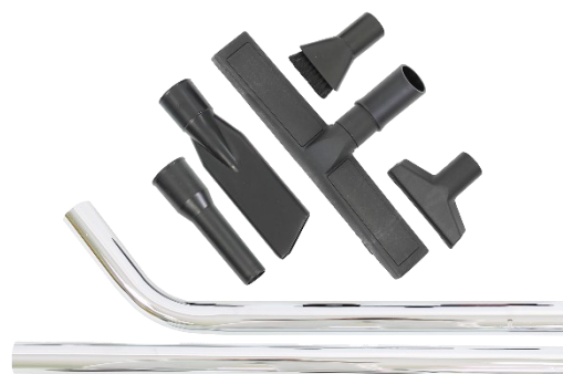
Kit Accessoires (Réf. 1098)